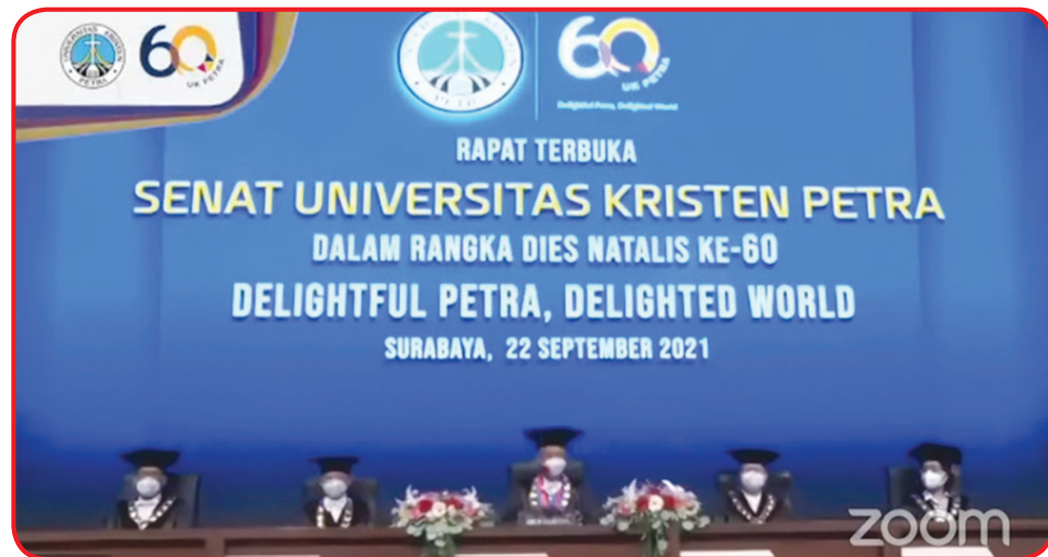
Rapat Terbuka Senat UK Petra.

Besaran dana beasiswa eksternal TA 2020/2021 sebesar Rp. 1.567.196.500, diteri-