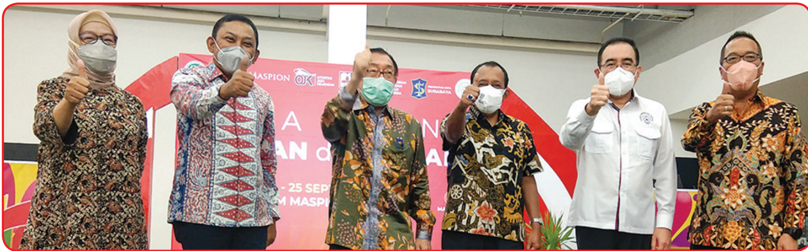
Semua pihak berfoto bersama.