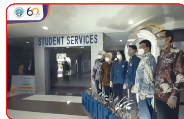
Foto bersama rektor.