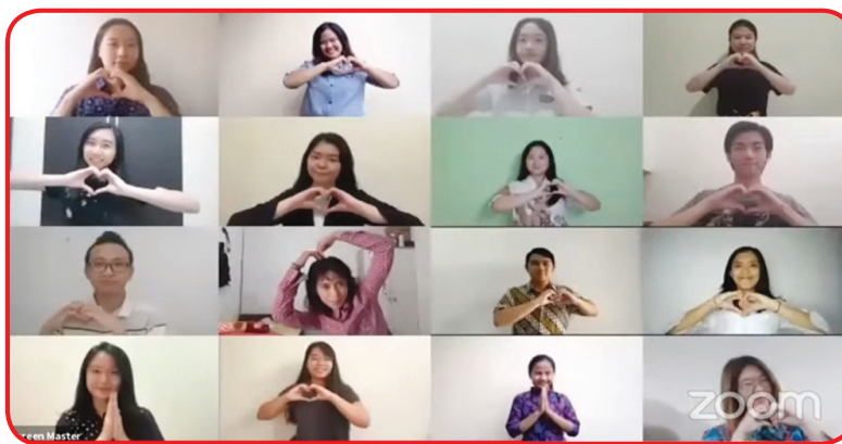
Mahasiswa UK Petra.

tentang perjalanan sejarah dan wawancara interaktif dengan dosen dan tenaga kependidikan UK Petra.