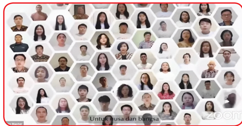
Paduan Suara UK Petra.