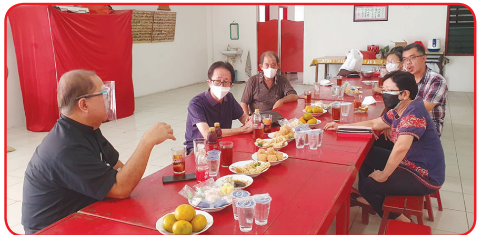
Kunjungan kerja di MAKIN Adiwerna.

Dalam kesempatan tersebut Budi menyebut akan dibangun Kelenteng baru di beberapa daerah dan gedung diklat Khonghucu di Jawa Barat. Setelah kunjungan ke MAKIN Tegal, Adiwerna dan Pekalongan Budi melanjutkan kunjungannya ke Lasem, Blora dan Semarang pada Kamis (23/9). • kris