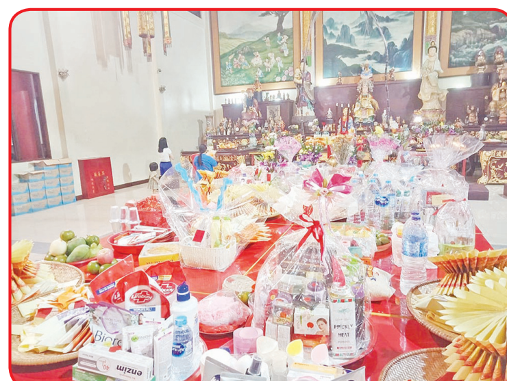
Sesaji yang terdiri dari kue bulan dan berbagai macam perlengkapan kosmetik.