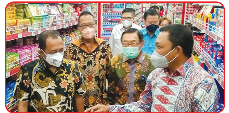
Rombongan meninjau swalayan Enak Eco yang baru buka di Maspion Square mall.