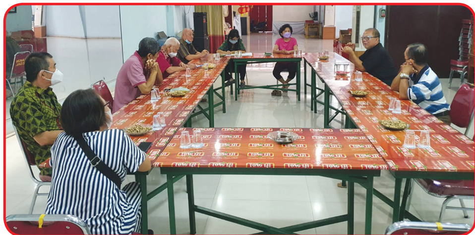
Kunjungan kerja di MAKIN Tegal.