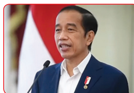
Presiden Joko Widodo.

Presiden mengapresiasi peran dan kontribusi UK Petra Surabaya bagi dunia pendidikan di Tanah Air dan menjadi Perguruan Tinggi Asuh bagi 10 Perguruan Tinggi Swasta di Medan,