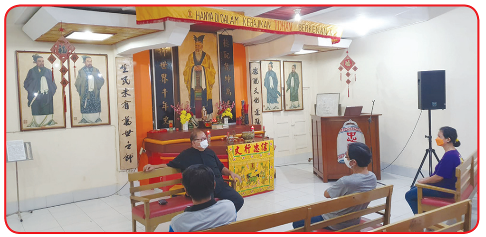
Kunjungan kerja di MAKIN Pekalongan.