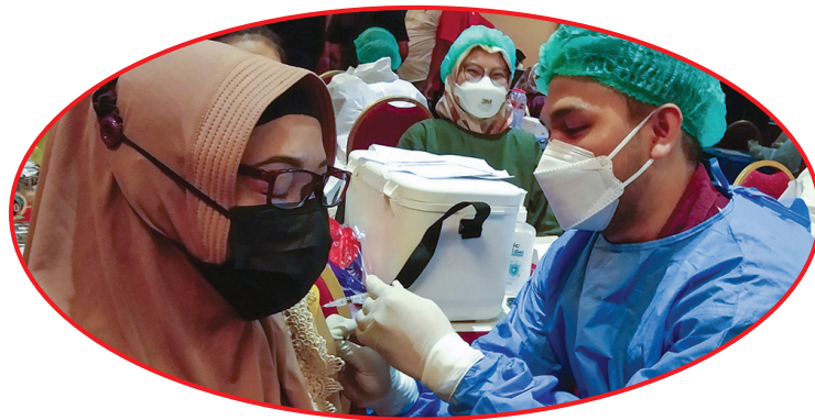
Seorang warga mendapat suntikan vaksin Sinovac dosis pertama.