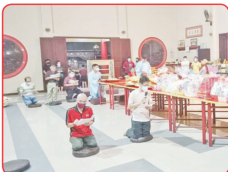
Umat sedang melakukan ritual sembahyang kue bulan.