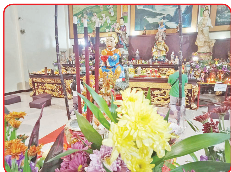
Suasana Vihara Triratna pada saat penyelenggaraan sembahyang kue bulan.

Sedangkan pada upacara sembahyang kue bulan sesaji yang diletakkan diatas altar yakni kue bulan dan perlengkapan kosmetik. • idn/din