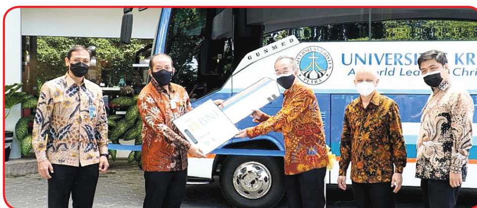
Penyerahan sumbangan satu unit bus dari Bank BNI untuk UK Petra.